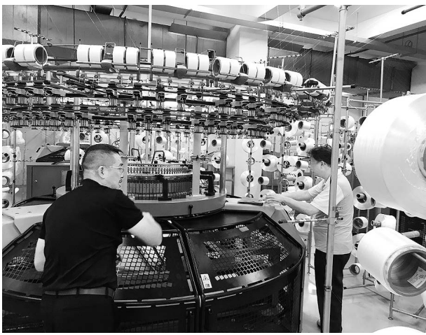
編み立ての新工場をまもなく開業する(達紡企業)

カー、両面とも表地で、11ミリの薄さながら高いストレッチ性とキックバック性を持つ「両面インナー、スポーツウエア用途の丸編み地」を開発した。