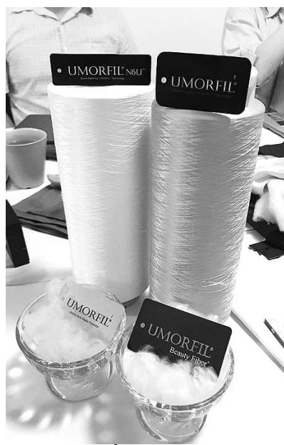
魚のうろこ由来のサステ素材「美肌繊維(ウモアフィル)」(博祥国際)

機能性サステ素材の「美肌繊維(ウモアフィル)」を展開する。同素材は魚のうろこ由来のコンチゲンが原料で、保湿などの肌への効果が期待できる。